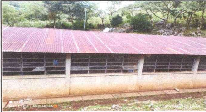
Foto1: Cambiar techos y costaneras de la escuela.